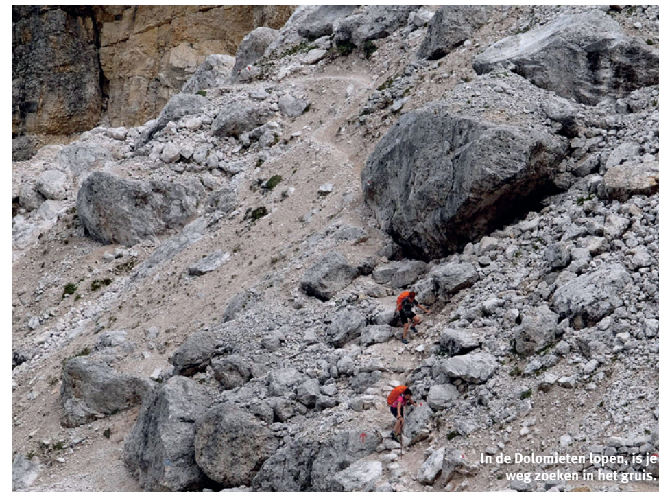
In de Dolomieten lopen, is je weg zoeken in het gruis.

Voordat het te gezellig wordt op het terras, stappen we in de voetsporen van deze stoere, sterke vrouw. Op naar de eerste hut, de Rifugio Rosetta, een populaire plek waar dagjesmensen en wandelaars elkaar treffen. Het is er vooral druk door de kabelbaan die honderd meter hoger eindigt. Wij laten de lift voor wat die is en klimmen vanuit het dal naar de hut. We hebben tijd genoeg, ook voor de huisberg van de hut, de Rosetta van 2743 meter.