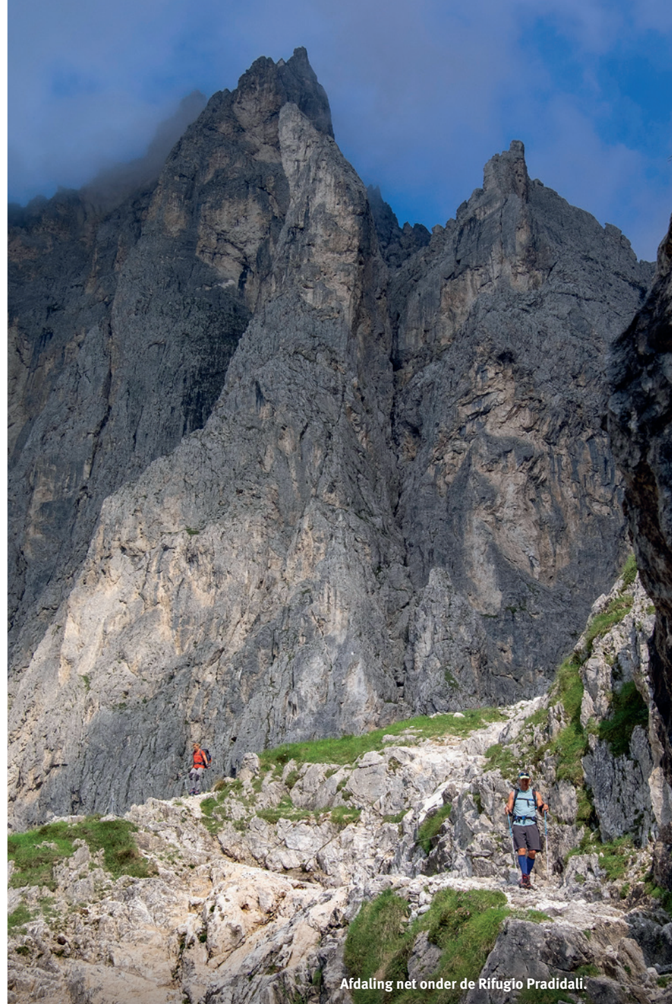
Afdaling net onder de Rifugio Pradidali.