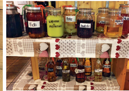
Foto links Zelfgestookte hazelnootlikeur in Rifugio Rosetta. Foto rechts De beheerders van Rifugio Rosetta maken er een sport van om van allerlei grondstoffen likeurtjes te stoken.