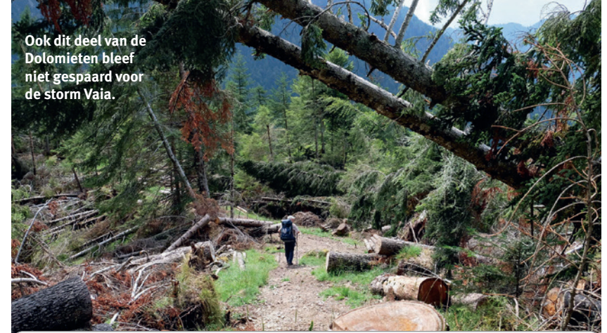
Ook dit deel van de Dolomieten bleef niet gespaard voor de storm Vaia.

Van de Rifugio Pradidali volgt een lange, steile, brokkelige afdaling, tot in het groen van de laaggelegen bossen. Een paar keer ontwijken we omgewaaide bomen en de donkere wolken