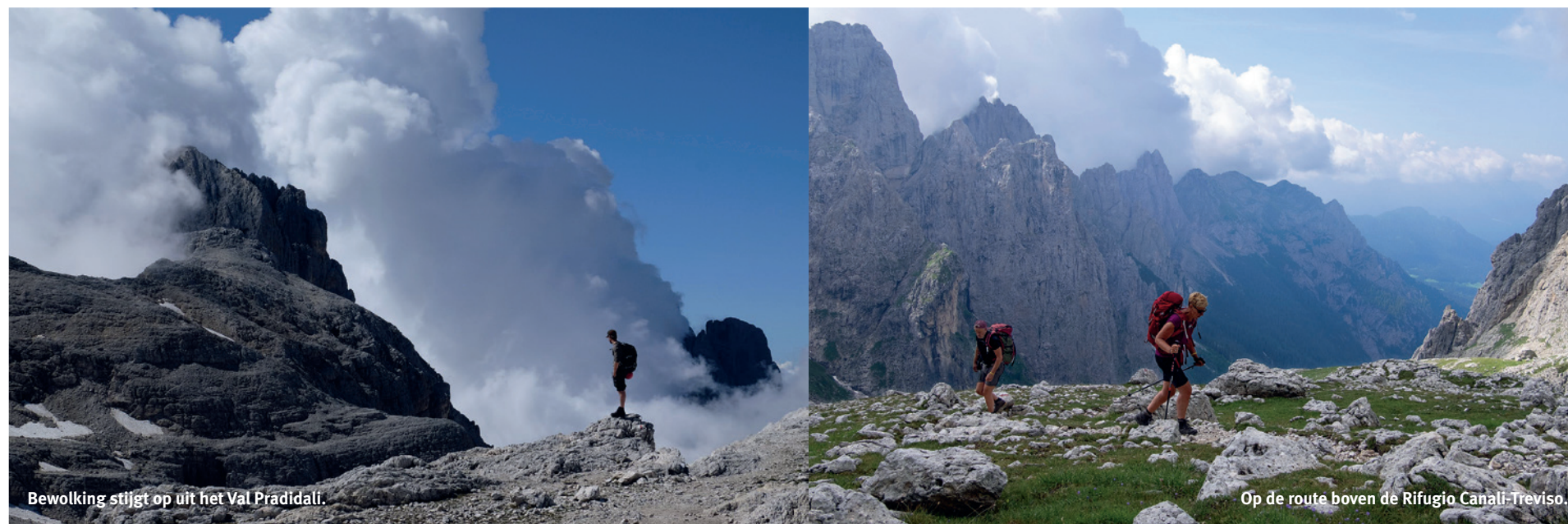
Bewolking stijgt op uit het Val Pradidali.