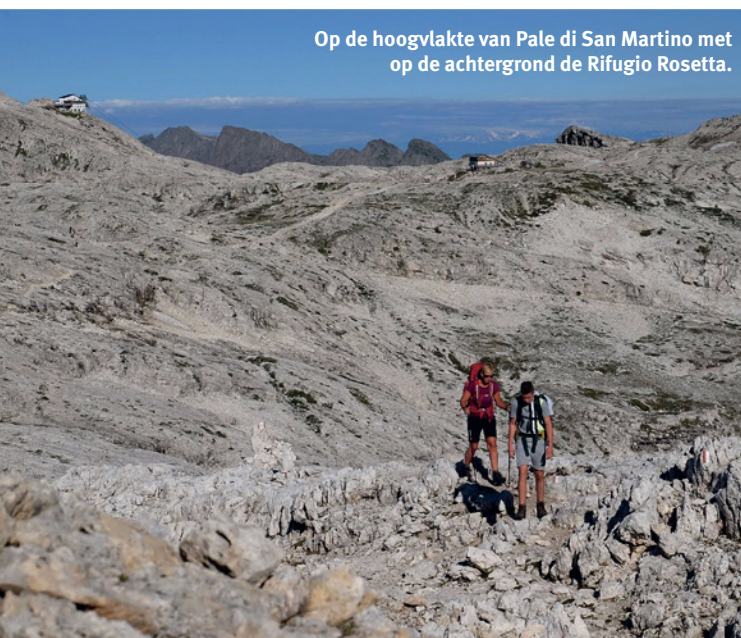
Op de hoogvlakte van Pale di San Martino met op de achtergrond de Rifugio Rosetta.